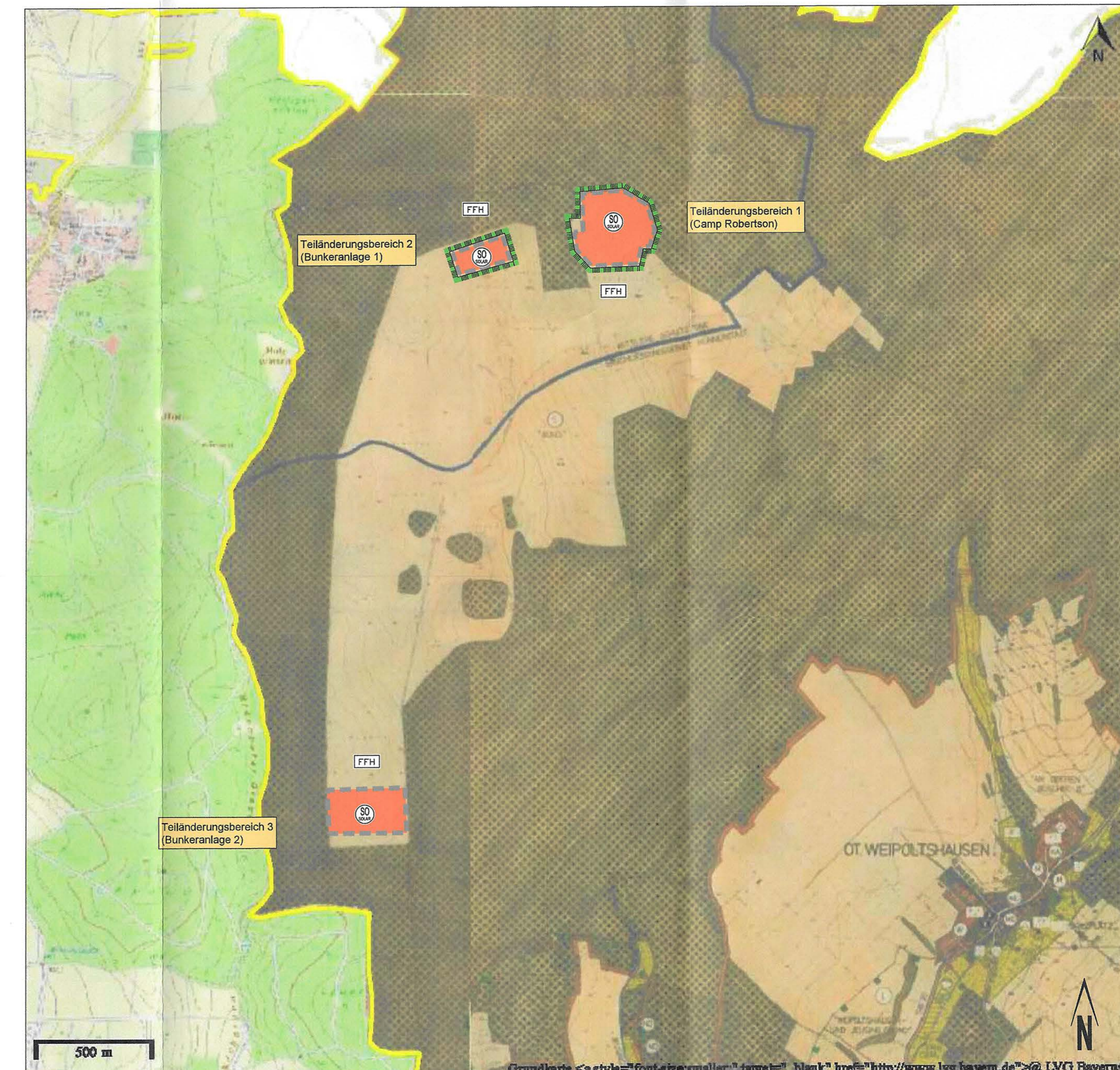
4. Änderung Flächennutzungsplan der Gemeinde Uchtelhausen Änderung von Sonderbaufeldern "Bund" in drei Teilflächen in Sonderbaufeldern für Freiflächensolaranlagen