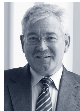
Vorstandsmitglieder der LfA Förderbank Bayern